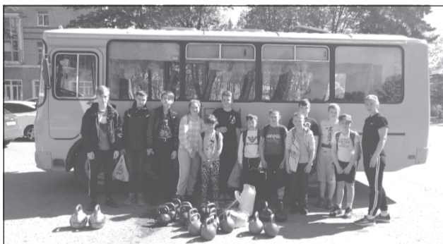
Ай да молодцы: из 12 ребят - 11 призёры