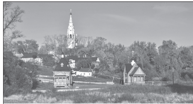
Приволжск в весеннем зелёном наряде

26 октября 1938 года образовался город Приволжск, но по традиции День города мы отмечаем в июне. Давайте вспомним некоторые исторические моменты, связанные с прошлым нашей малой родины. Предлагаем вам принять участие в краеведческой викторине.