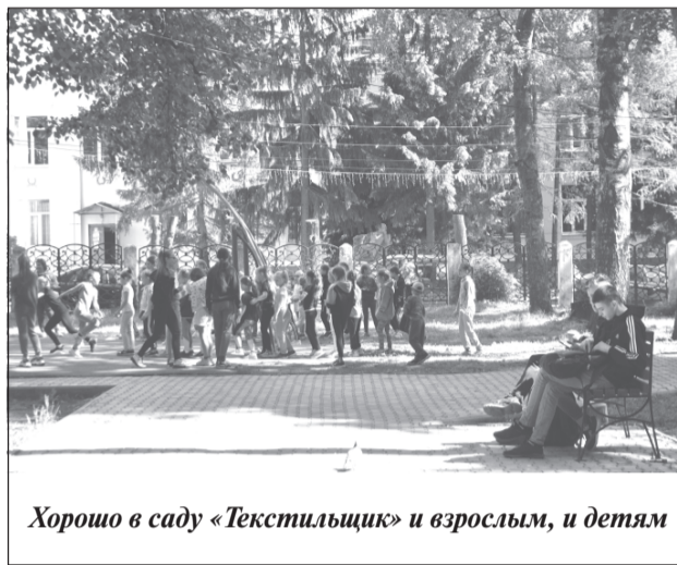
Хорошо в саду «Текстильщик» и взрослым, и детям

Кто проходит мимо городской площади, тот видит, какие грандиозные работы здесь идут в данный момент. И в скором времени центр Приволжска будет не узнать.