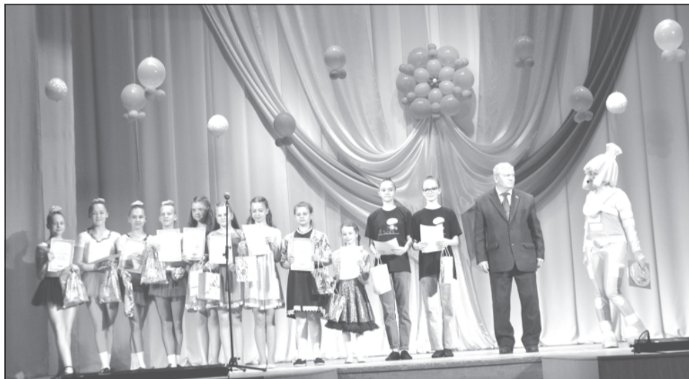
Лучшие из лучших награждены Благодарностями отдела культуры

щённого Международному дню защиты детей, у ребят-кружковцев ГДК. Это вам не вопросы у доски в школе, на них отвечать всегда радостно и приятно! Здорово, что вообще есть летние каникулы и сам праздник, их открывающий!