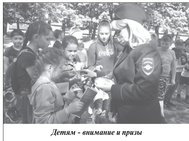
Детям - внимание и призы

пасного поведения на дороге, объяснили, какие ошибки на дороге могут привести к аварийным ситуациям и как избежать та-