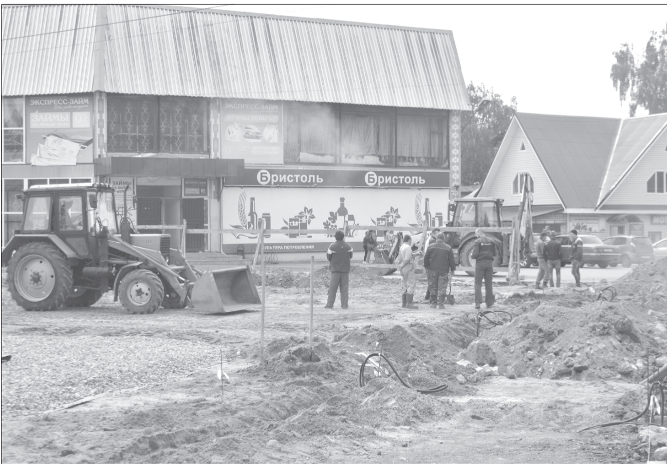
На площади Революции идёт замена коммуникаций

Приволжск вошел в число городов - победителей Всероссийского конкурса лучших проектов создания комфортной городской среды в малых городах и исторических поселениях, получив грант на преобразование центральной части города. Главным местом, где проходят строительные работы, стала площадь Революции. Проект представлен Центром территориального развития Ивановской области.