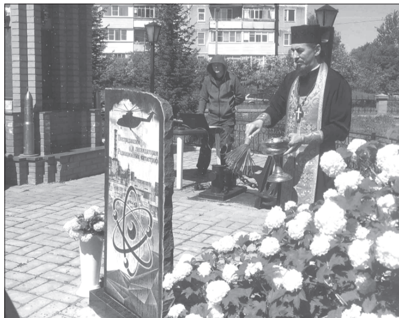
Памятник пострадавшим и ликвидаторам ядерных катастроф установлен в Волгореченске

35 лет прошло с момента аварии на Чернобыльской АЭС, но в памяти очевидцев по-прежнему свежи воспоминания о тех трагических днях. Многие наши земляки принимали участие в ликвидации последствий атомного взрыва. В Волгореченске, например, у наших ближайших соседей, в операции участвовали 107 жителей.