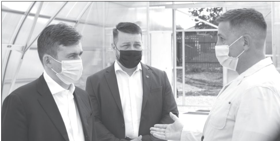
Разговор о проектах и проблемах.