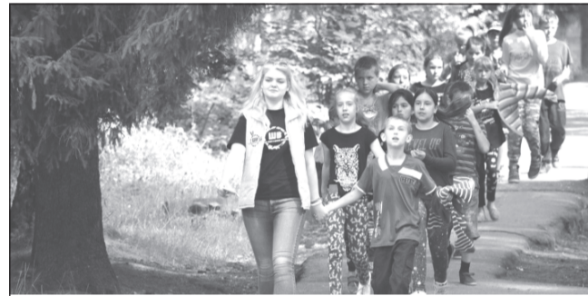
Куда идём? В столовую

Отметим, к программе уже присоединяются лагеря Ивановской области: с кешбэком можно отправить ребенка в лагерь «Огонёк», «Ломы» и «Чайка плюс». Список лагерей-участников программы будет пополняться и в дальнейшем.