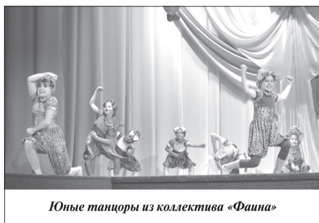
Юные танцоры из коллектива «Фаина»

Весёлые Фиксики — Симка и Нолик артистично и непринуждённо вовлекли девочек и мальчиков в игры и конкурсы, объявляли выступление творческих коллективов дома культуры. И ребята-зрители вдруг превращались в артистов: обыкновенные наши детишки, оказавшись на сцене, сказочно