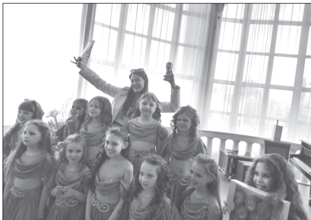
Танец - это правильный выбор: красота, грация, позитив